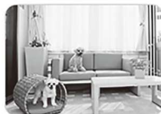
オーダーカーテン プランシェ