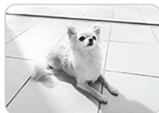
ペット対応床タイル スタイルプラス フォスキー