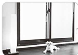
防音・断熱内窓 インプラス