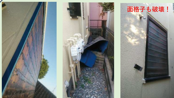
突風にあおられて防水紙ごとズルッと脱落！